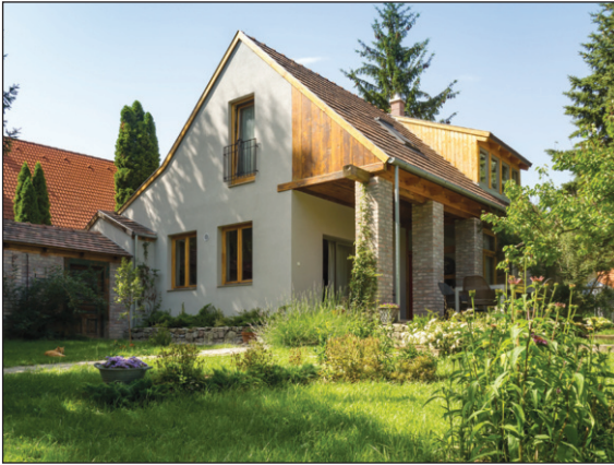
28. kép: Szentendre, családi ház felújítása és bővítése, terv: Erhardt Gábor, fotó: Kedves Zsófia és Erhardt Gábor.