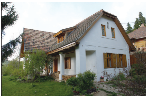
6. kép: Pilisszentlélek, családi ház, terv: Csóka Balázs – veranda.