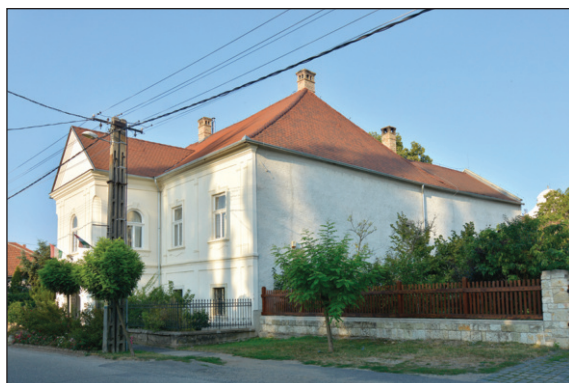
3. kép: Mád, Rákóczi-Aspremont-cúria felújítása, terv: Erhardt Gábor, fotó: Szántó Tamás.