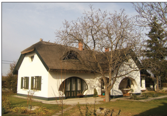
5. kép: Tass, családi ház felújítása és bővítése, terv és fotó: Czégány Sándor.

A mai „modern” ember számára (akár városban, akár vidéken, falun él) a természettel való kapcsolat – jó esetben – a fűnyírásban, illetve a tujasor karbantartásában merül ki. A dús, áthatolhatatlan patakparti növényzet már nem rejt értéket a számunkra. Minden csupán annyiban elfogadható nekünk, amennyiben átlátható, akár a primitívségig rendezett. Ez igaz a mezőgazdaságban dolgozókra is, akik mindennapjaikat valóban a tájban, a „természetben” töltik. Én ezt – többek között – szintén a XX. század eleji modernizmus közvetlen, vagy talán közvetett következményeként értékelem. Ahogy Molnár Farkas bon motja szól: „az íves vonal a neurózis, az egyenes a rend”. Minél leegyszerűsítettebben élünk, annál vállalhatóbbak vagyunk. Ebbe a trendbe a modernizmus építészete teljes egészében beleállt. Mára a klasszikus modernitás (!) társadalmi elkötelezettsége és elvont alapokon nyugvó természetisztelete helyett egy talmi, formalista modernizmus (!) maradt. A végletekig leegyszerűsödő formavilág és anyaghasználat mögött egy átláthatatlanul bonyolult szerkezeti, technológiai és világgazdasági rend húzódik. Ezt hívjuk leegyszerűsítve (technikai) fejlődésnek, gazdasági fejlődésnek, amelynek töretlenségében feltétel nélkül hisz az emberiség, a „gazdaságkor” 4 embere.