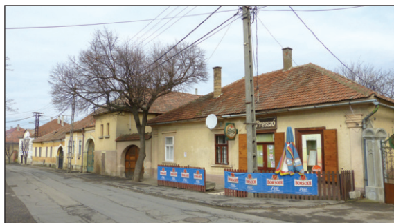
4. kép: Tállya, utcakép.