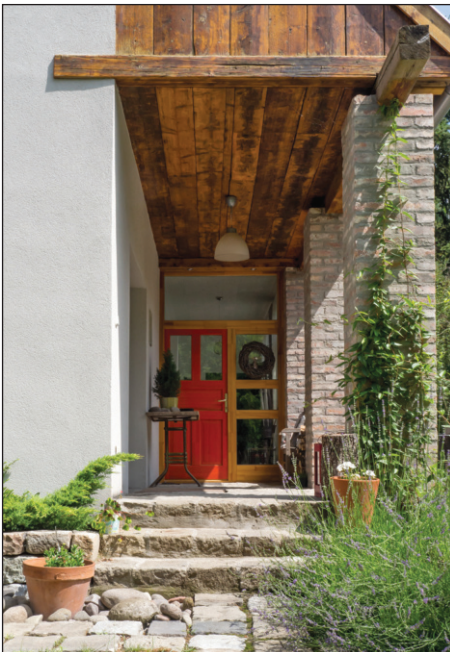
29. kép: Szentendre, családi ház felújítása és bővítése, terv: Erhardt Gábor, fotó: Kedves Zsófia és Erhardt Gábor.