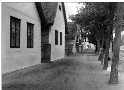
Hagyományos utcaképek: Vasvár, Fortepan / építész, Falusi utcakép, Fortepan / Sütő János

A magyar falvak alapeleme, a Kárpát-medencei úgynevezett háromsztatú lakóház önmagában is megérne egy önálló előadást. Három irányban működő hármassága, háromsztatúsága egy egységes, a több ezer éves univerzális kultúrtörténetbe illeszkedő ikonográfiával, jelentésrétegekkel bírt. Alapvetései a sztyeppék jurtaítoit eredeztethetők, és egy sajátos, egységes világlátást közvetítenek, még ha e sajátosságokat, szellemi tartalmakat a tudományosság nem is vizsgálta, megelégedve az anyagi, szerkezeti megoldások szerinti csoportosítással.